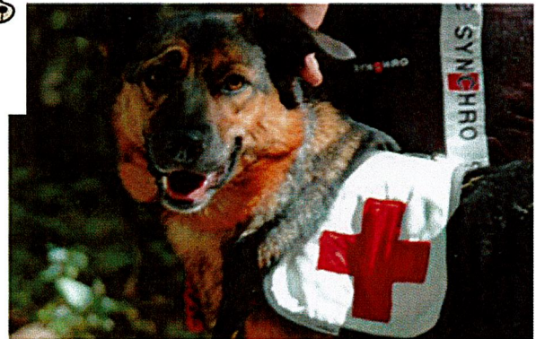
Cane da ricerca

Ringraziamo tutti per il massimo rispetto di queste elementari regole di comportamento.