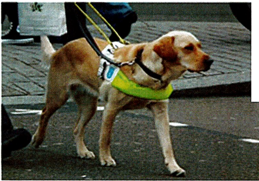
Cane conduttore non vedenti

Sarebbe buona educazione, quando incontriamo cani di conduttori di non vedenti, cani da ricerca, cani poliziotto, cani che hanno attaccato al loro guinzaglio o al collare un fiocco giallo, nelle zone permesse ai cavallieri, in zone con presenti altri animali: RICHIAMARE E LEGARE IL VOSTRO CANE.